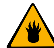
Gaz ou liquide inflammable