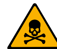
Matière ou gaz toxique