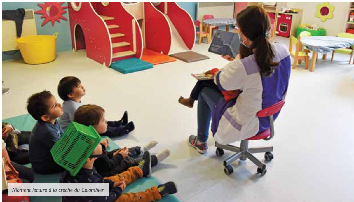
Moment lecture à la crèche du Colombier

que le salaire des parents, l'amplitude horaire demandée, le nombre de demandes antérieures rejetées ou refusées, la situation de la fratrie... À noter, il est possible de faire une demande pour un enfant qui ne serait pas encore né, et ce dès le septième mois de grossesse.