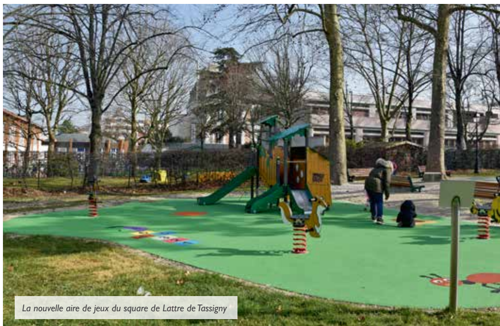
La nouvelle aire de jeux du square de Lattre de Tassigny

Accessibles pour partie en accès libre, pour partie lors des horaires d'ouverture, différents en été et en hiver, les espaces verts municipaux ferment actuellement à 18 h 45 en raison du couvre-feu décrété sur le territoire national. Voici une présentation des 11 parcs et jardins de la Ville.