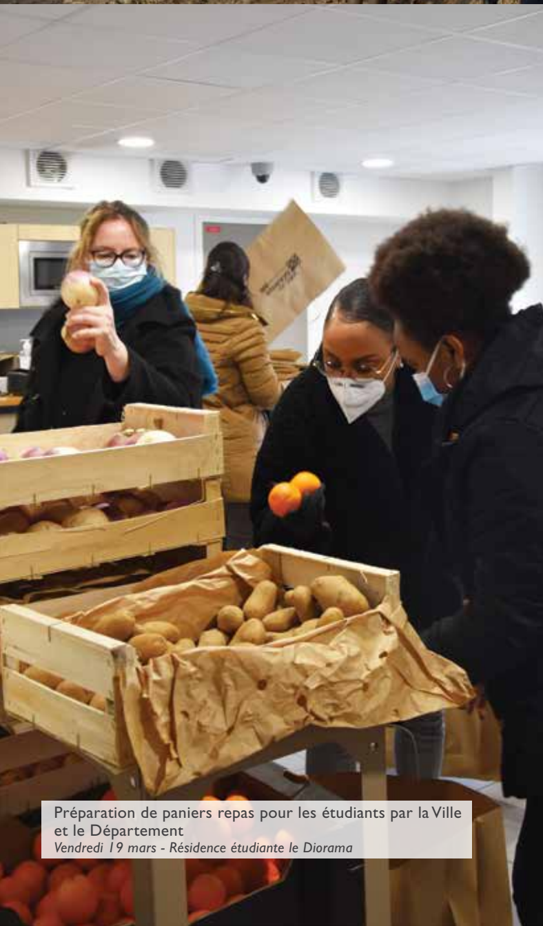
Préparation de paniers repas pour les étudiants par la Ville et le Département Vendredi 19 mars - Résidence étudiante le Diorama