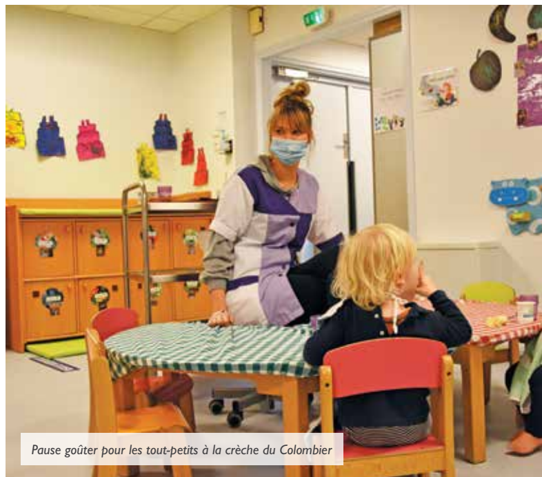
Pause goûter pour les tout-petits à la crèche du Colombier

Désormais, toutes les demandes de places en crèche, qu'elle soit