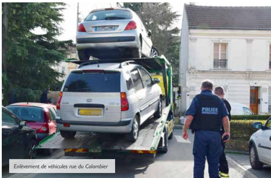
Enlèvement de véhicules rue du Colombier

Certaines infractions aux règles de stationnement précisées dans le Code de la route peuvent entraîner une mise en fourrière des véhicules stationnés sur la voie publique. C'est le cas par exemple de ceux qui sont garés de manière gênante sur la voirie ou sur une place qui ne leur était pas dédiée, comme une place réservée aux personnes en situation de handicap. De la