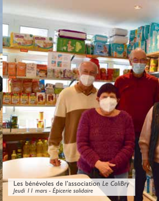
Les bénévoles de l'association Le ColiBry Jeudi 11 mars - Épicerie solidaire