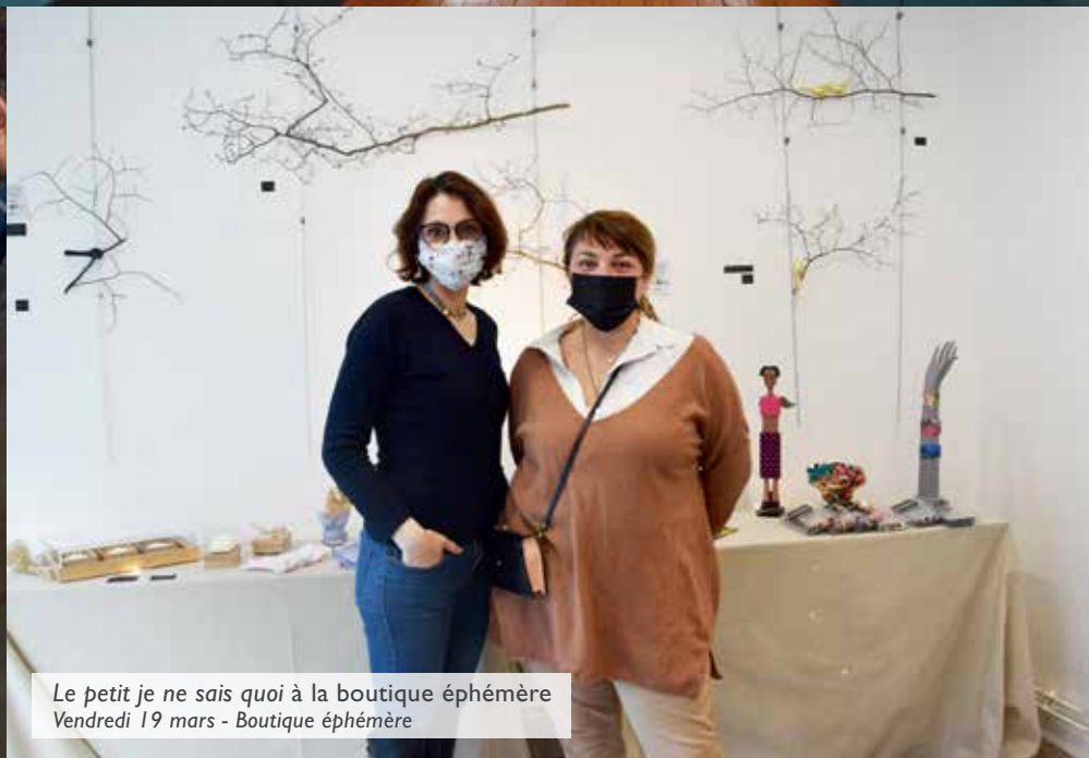
Le petit je ne sais quoi à la boutique éphémère Vendredi 19 mars - Boutique éphémère