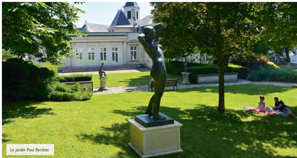
Le jardin Paul Berthet