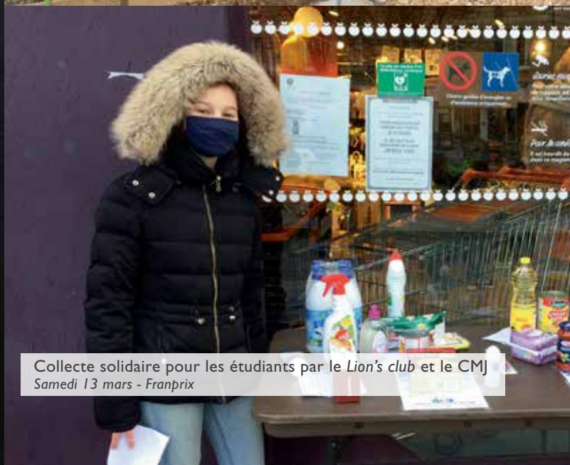
Collecte solidaire pour les étudiants par le Lion's club et le CMJ Samedi 13 mars - Franprix