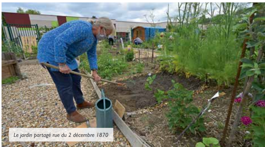
Le jardin partagé rue du 2 décembre 1870