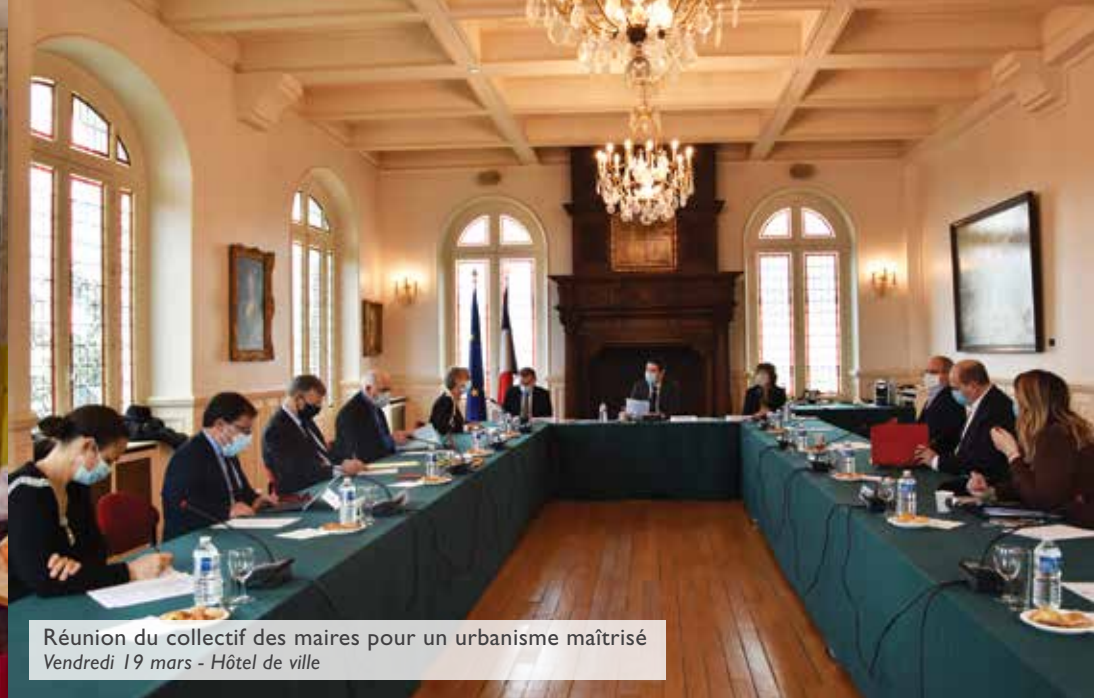
Réunion du collectif des maires pour un urbanisme maîtrisé Vendredi 19 mars - Hôtel de ville