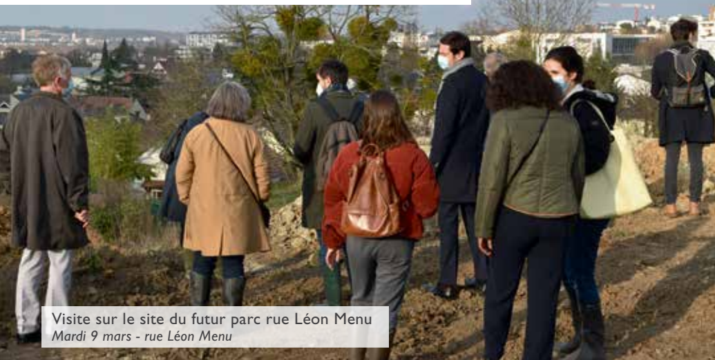
Visite sur le site du futur parc rue Léon Menu Mardi 9 mars - rue Léon Menu